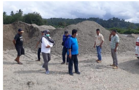
Gambar 1. Survei Lapangan