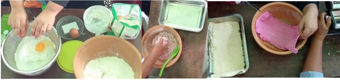
Gambar 5. Proses pembuatan adonan Mie dan Hasil lembaran adonan Mie tepung substitusi singkong