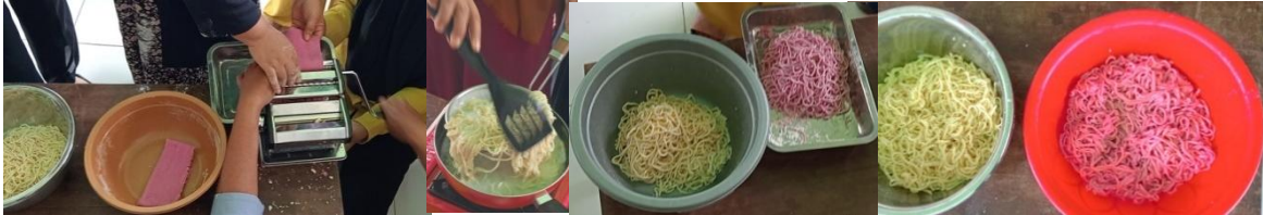
Gambar 6. Proses pencetakan Mie, hasil cetak Mie, Proses merebus dan Hasil rebusan Mie tepung Substitusi Singkong oleh KWT Mandiri Jaya Desa Wawohine Kecamatan Amonggedo Kabupaten Konawe