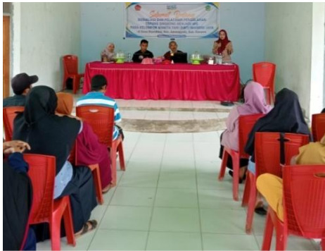
Gambar 4. Sosialisasi Keunggulan Prodi Teknologi Hasil Pertanian, Peternakan & Agribisnis mesin cetak mie oleh Ketua dan Tim Kepala Desa Wawohine.