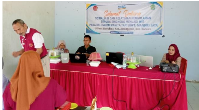
Gambar 5. Pendampingan Proses Pembuatan Mie Substitusi Tepung Singkong pada KWT