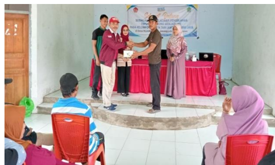
Gambar 3. Penyerahan bantuan mesin cetak mie oleh Ketua dan Tim Kepala Desa